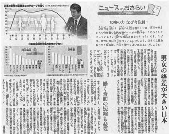
紙面2 朝日新聞 11月1日付夕刊

女性の活躍が進まないのは、女性がそもそも働くことを望んでいないからだと言われることがある。前述の通り、日本では女子の大学進学率がいまだに男子を下回っている。この背景には、母親が専業主婦である場合は、それ以外の選択肢がイメージしにくいという問題がある。